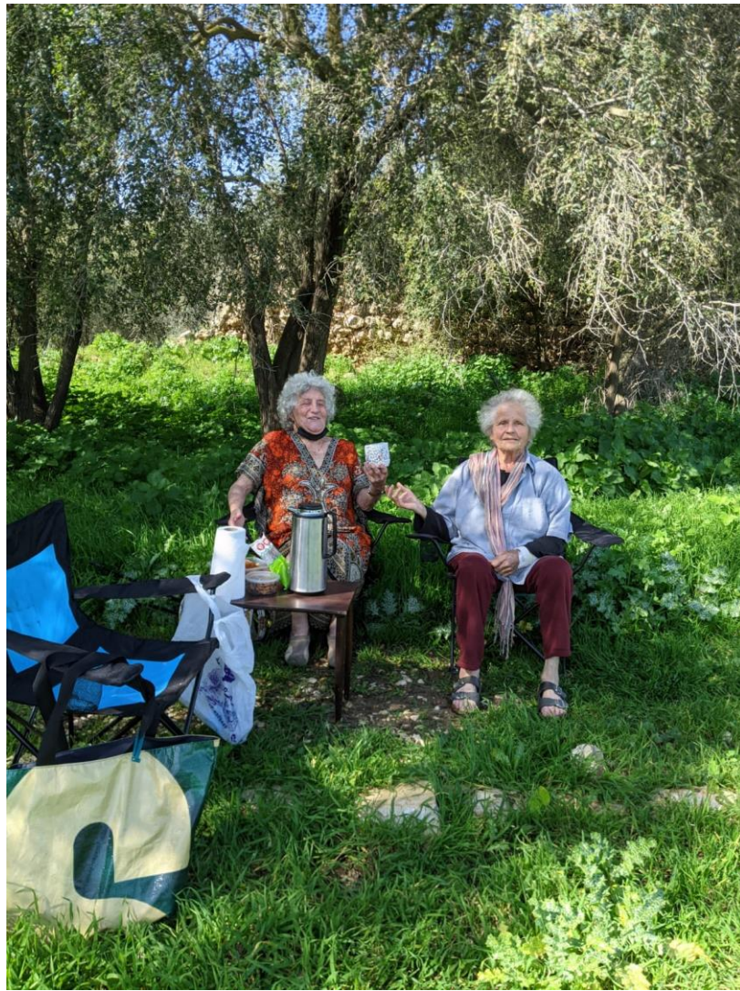
מועדון כ-שישים בחיק הטבע